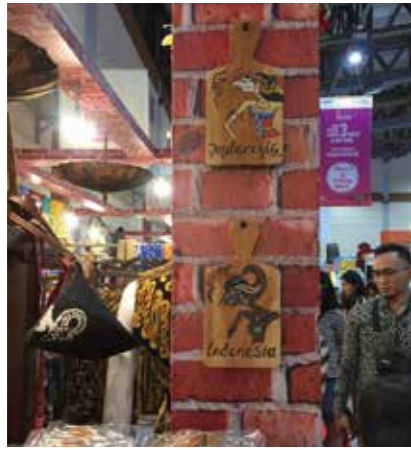
楽しいイナクラフト

年に一度（大体日本の春頃）開催される国内最大級のクラフト展、（イナクラフト）。スナヤンの展示場いっぱいにはたくさんのお店があるので、1日がかりで参戦します。（広くて疲れますが）見て回るだけでも楽しいです。パリのジェンガラをお買い求めになる日本人の方が多かったです。