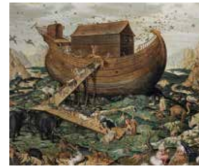
デウカリオン夫婦の船