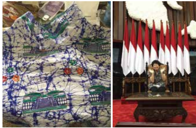
（上左）国会バティック

業務上要人と会う際は、その出身地のバティックを身につけて会うだけで、話が弾みます。ジャカルタのバティックはモナスやオンデル・オンデルがモチーフだったり、パプアのバティックはホナイや極楽鳥がモチーフだったり、眺めていても飽きることはありません。日本でいうところの国会議事堂の中にも、立派な革製品や衣服、バティックなどが売られている土産物店があり、カブトムシのような形の建物をモチーフにしたバティックを見つけた私は、面白いので即買いし、テイラーで仕立てて同僚に見せて回りました。