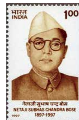
チャンドラ・ボーズ

(前略) 先生たちが戦争のことあんまり教えてくれなかったって確か? おかしな国でんな。自分たちがしたことを、きっちりと子供たちに教えていかないかんのにね。まあ、ええですわ。あのね、日本が大東亜共栄圏やゆうてアジアのみなさんに声掛けて一緒にがんばろうって叫びはった頃にでんな、インドでもイギリスと戦って独立しようちゅうグループがあったんですわ。日本で有名なガンジーさんね。このヒトのことは当然知ってはりますやろな? えっ、詳しくは知らんて? 学校の図書館にありましたやろ、この人の伝記が。まあ、ええわこれも。ガンジーさんとボーズさんは同じ国民会議派ちゅう仲間でしたんや。けど二人は考え方が違うたんですわ。ガンジーさんは暴力はあかん、我慢や、辛抱やゆうて独立をしようとはったんですわ。でもねボーズさんは、それではあかんて言いはってな、ドイツへ亡命したり、潜水艦で日本に運ばれはったり、シンガポールで日本の捕虜になったインドの兵隊さんとインド国民軍ちゅう軍隊つくって総司令官になりはって、そんでインパールに行かはったんですわ。さしずめ日本の同志、戦友、盟友ちゅう訳でんな。けどボーズさんな終戦の年に台湾上空で飛行機事故で死んでしもうたんですわ。かわいそうにね。その遺骨が東京に保存されてまんねん、そして多くのインドのヒトたちがそのお寺さんにお参りに行かはるんでっせ。(後略)