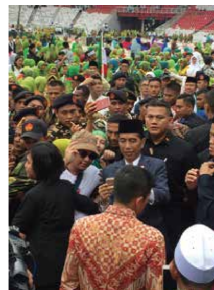
NU女性部の全国大会で自撮り希望に囲まれるジョコウィ。 ジャカルタで開催されたNU (ナフダトゥール・ウラマー) 10万人とも。 スピーチを終え、大統領が退室する際に押し寄せる自撮り希望者 (当方も来賓席 (ルフト大臣やら現役閣僚の真後ろ)