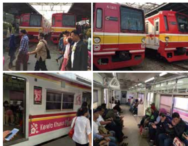
これは女性専用車両

私がブカシ駅に行ったのは土曜日でした。電車が到着すると大勢の人がおりてくるので改札とホームをの間のを結ぶ通路は混雑しました。(後略)