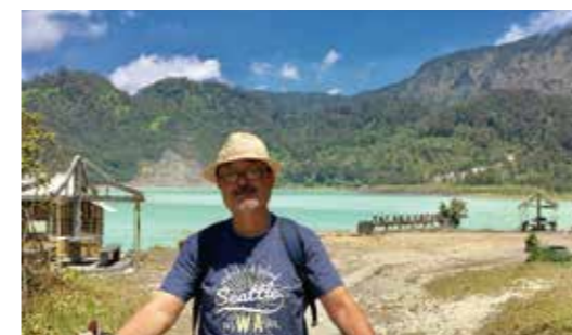
坂を下りるとそこには白い湖が

(前略)上り坂が終わり、少し下り道を歩くと、その道の先に白い湖が姿を見せました。湖の水面がまっ白なのです。タラガ・ボダス=白い湖そのものでした。(タラガは湖、ボダスは白い)。早速、水際に『TALAGA BODAS』と大きく書いてあるところで記