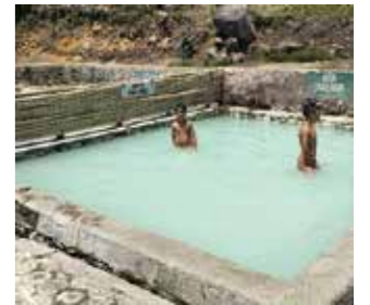
子ども用プールに男の子二人

5分ほど湖の回りを歩いて行くと、着替えをする小屋の向こうにコンクリートのプールが見え、そこには子供が二人おちんちん丸出しの素っ裸で入っていま