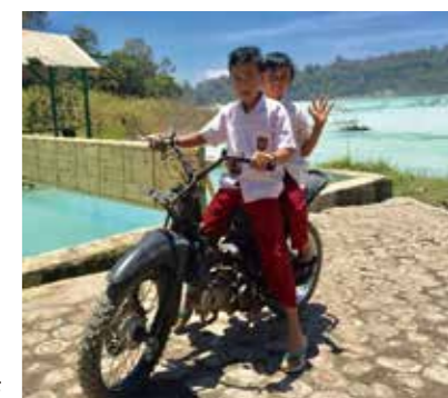
バイクで帰る小学生