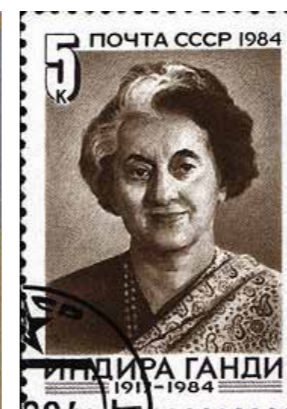
ネルーの娘 インデラ・ガンジー

叔父：そうなんだ。そのヤマトタケルはその気性の荒さから父の景行天皇に嫌われ日本中の敵をやっつけるように東に西につかわされたんだ。これも旧約聖書でダビデが王になる前に逃亡生活していたのとそっくりなんだ。でもヤマトタケルは最後に都に帰る途中で草薙の剣を尾張のミヤズヒメに預けたまま伊吹山の神にやられて亡くなってしまったんだ。