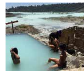
大人用プールで運転手さんと

深さは子供が立っても十分頭が出る程度でした。私と運転手さんは近くの更衣室で着替えて早速湯につかりました。子供たちに聞くと二人はその近く村の子で午前の部の学校を終えて湯に入りきたとのこ