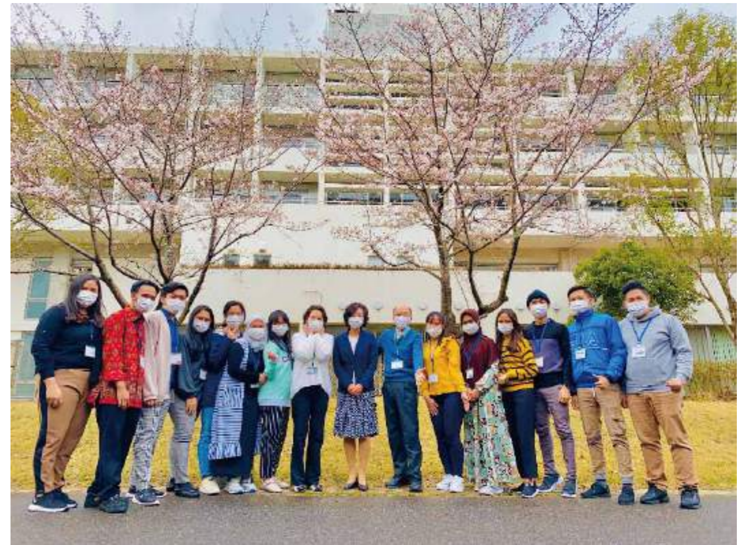
研修生と阪大インドネシア語専攻学生との交流会（大阪）