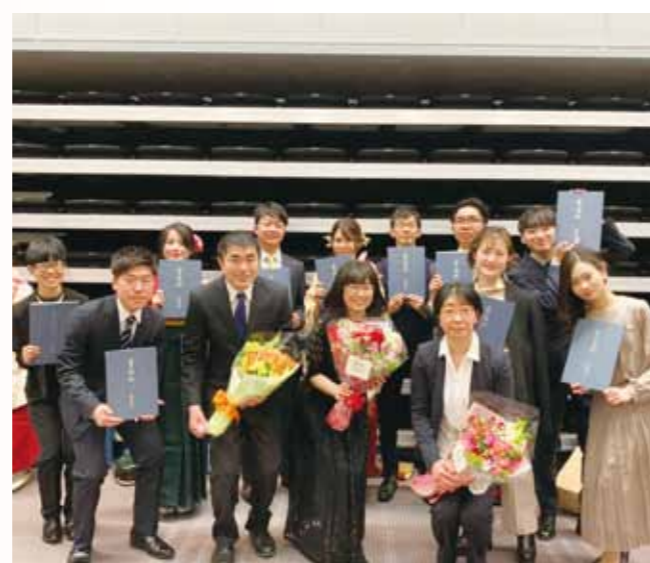
2020年度卒業式 (2021年3月26日)

外 国語学部の学位記授与式は、大阪大学全体の卒業式が大阪城ホールで開かれた後、その近くのIMPホールで開催された。卒業式が無事開催され、教員もほっとしたとともに、卒業生にとつても、やはり感染症との関係で式典関係の開催が難しい中で、卒業式に参加できたということで特別な思い出となったのではないだろうか。