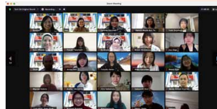
インドネシア大学オンライン留学

そ してよいよ今年4月から新しいキャンパスでの授業が開始された。昨年1年の様々な出来事を糧としつつ、新たな船出を祝いたい。