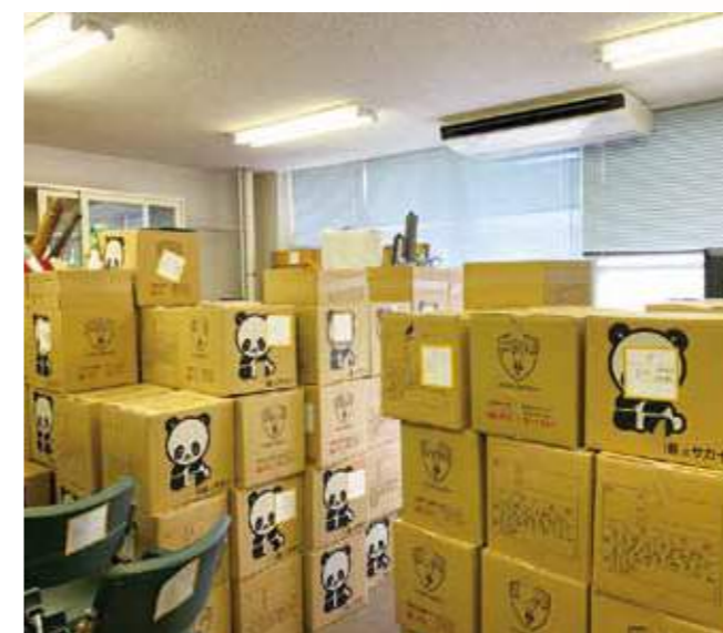
引っ越し作業の様子