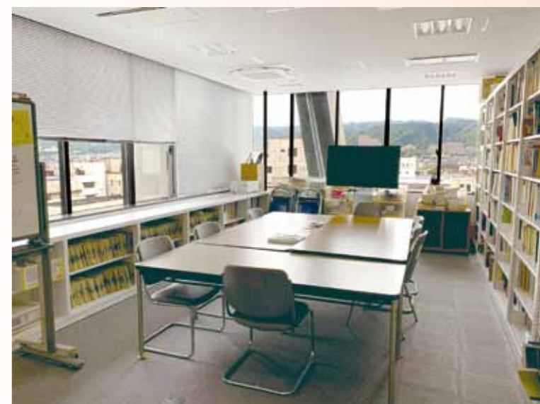
新しい専攻共同研究室